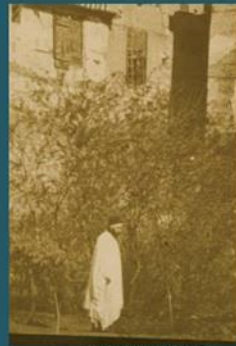
Flaubert au CAIRE, dans le jardin de l'hôtel du Nil, photographié par MAXIME du CAMP